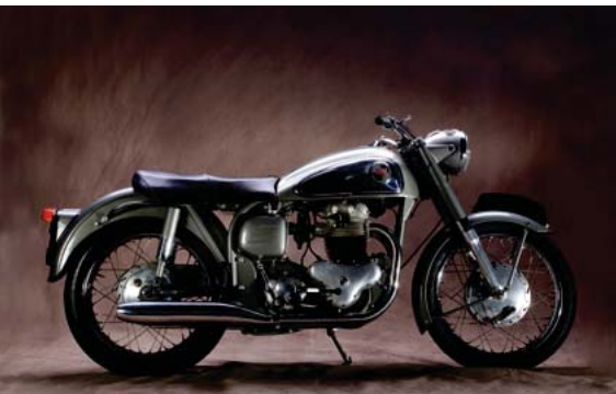
Motos de collection de M.MIGEON