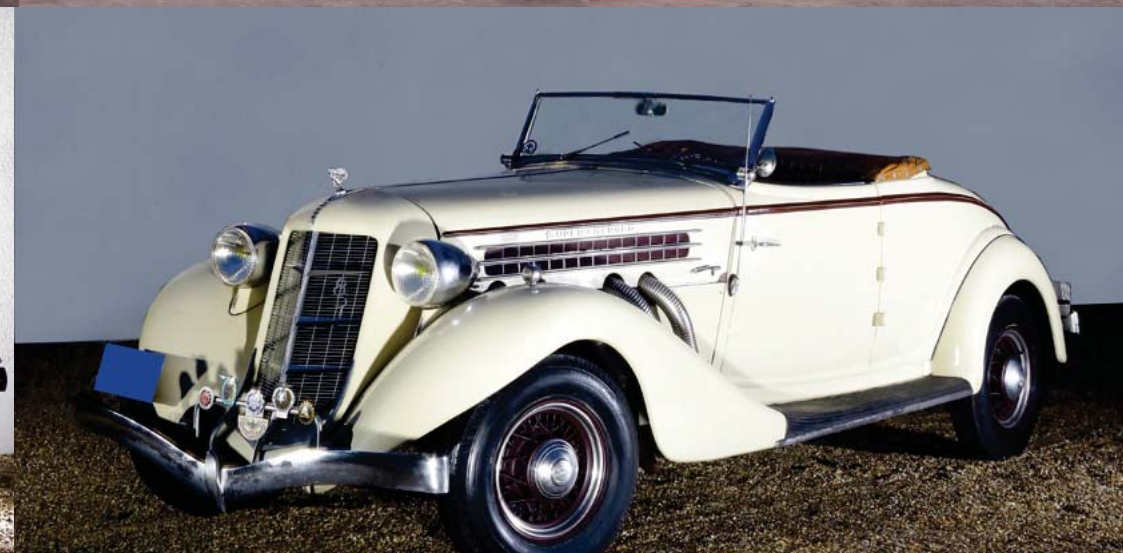
Automobiles de collection de M.COCHETEUX