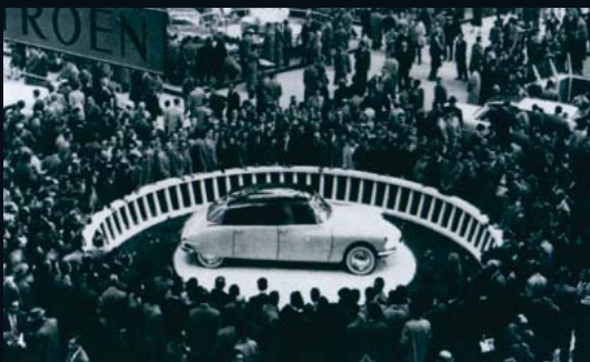
L'étoile du Salon 1955 tourne lentement sur son stand, indifférente à l'agitation alentour.

"Je crois que je m'en souviendrai toute ma vie. Mon père n'était pas spécialement intéressé par l'automobile, mais un certain jour d'octobre 1955, il est rentré plus tôt à la maison pour m'emmener chez Pichard, le concessionnaire Citroën de Tours, voir la nouvelle DS.