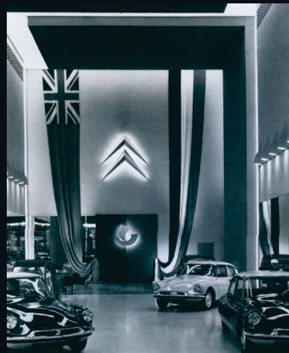
Fin 1956, DS et ID dans le salon d'exposition de Citroën sur les Champs-Élysées. Les drapeaux rappellent la visite de la Reine d'Angleterre.

Jacques Wolgensinger, livre de Olivier de Serres "DS le grand livre" éditions EPA